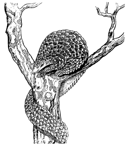
Manis tricuspis (Illustration: Bernardin Nabana)

Tous les rapports coloniaux de l'époque insistaient sur le fait que les tribus de la région étaient intéressées par un commerce direct avec les firmes européennes et ceci d'autant plus qu'ils ne connaissaient pas encore les pratiques coloniales (Käzelitz 1968: 40). C'était le moyen pour elles et pour leurs chefs d'étendre leurs activités commerciales que monopolisaient les Haoussa, d'accroître égale-